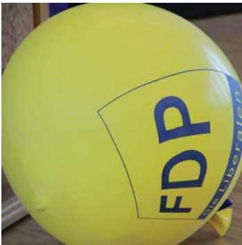
Die DeKo war abwechslungsreich