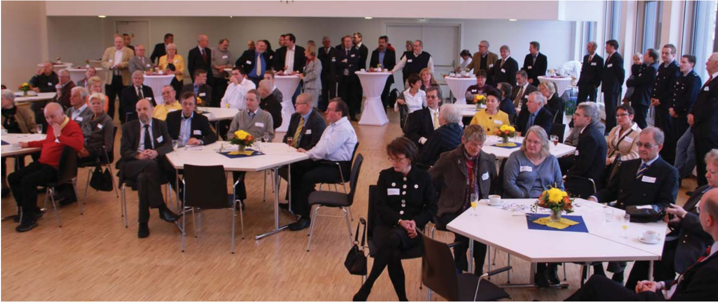
Der Bürgersaal war mit rund 120 Gästen prall gefüllt.