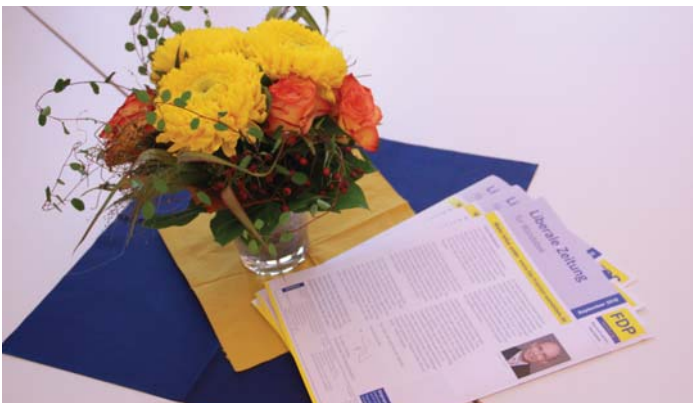
Die Tische waren liebevoll eingedeckt