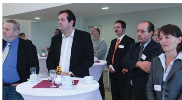
Interessierte Parteifreunde lauschen den Reden